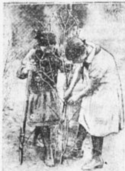
Готовься к «Дню леса».