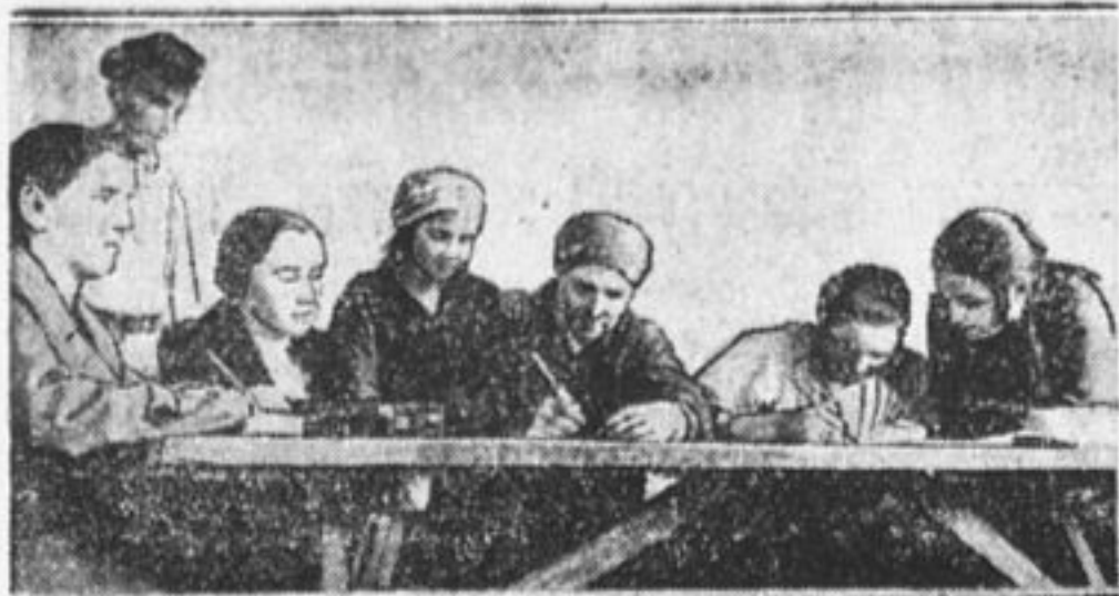
Комиссия проверяет знания двух женщин, у которых пионеры ликвидировали неграмотность.