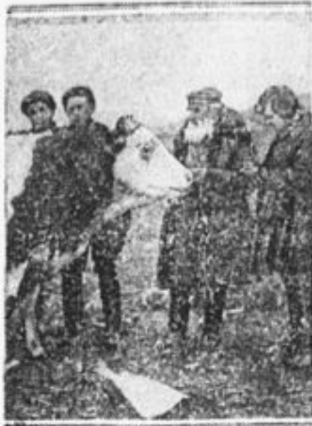
БССР. Артель «Эмес».

(Местечко Паричи, Бобруйского окр., БССР).