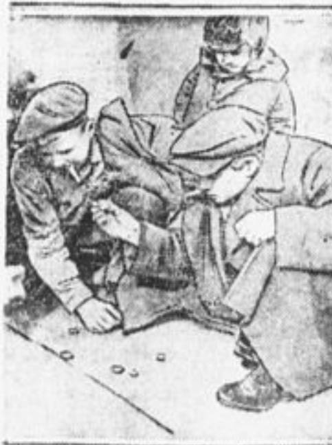
Заменим «орлянку» туризмом.

В воде горели полосы огня, По лодке волны колотились чутко. Протяжно доносились до меня Из камышей туманных крики уток. Я не гребу. Несет теченьем лодку. Раскинулся далеко город позади. Автомобиль, раскрыв сирены глотку, Колес резиною упругою шуршит... ... Как хорошо! Здесь нету ед- кой пыли. Нет мостовых, нет грохота ма- шин. Здесь только волны в лодку колотились Да хлопали от ветра камыши. В воде плясали полосы огня, По лодке мягко ударялись волны. Запах травы тянулся до меня С широко разостлавшегося поля. Деткор Богатов.