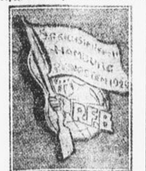
Значок союза немецких красных фронтовиков, вышущенный к предстоящему смотру.

Три года назад два советских комсомольца возвращались из кругосветного путешествия. На велосипедах, шины которых были советского изделия, с красным флажком на руле, они обехали много стран. Их встречали по-разному. Во французском порту их жестоко избили белогвардейцы, метя им за свое изгнание; в Японии их любезно встретили и проводили шпика (сыщики), не давая им оглянуться, передохнуть, а тем более посмотреть страну. В Мексике рабочая молодежь радостно жала им руки, гладила их стальных коней, пела им мексиканские песни и учила их лозунгам на мексиканском языке.