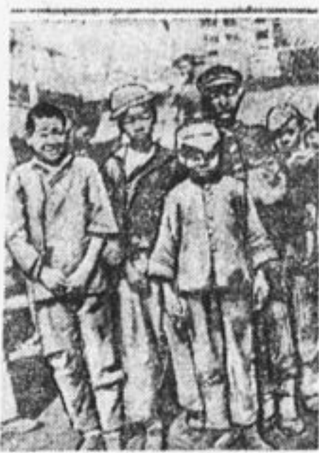
По 10—12 часов работают ребята-грузчики в Японии, получая гроши для того...

На группу в 25 ребят набросилось 40 полицейских, которые немилосердно избивали пионеров. Вожатую сбросили на землю и начали бить палками, а потом втащили в автомобиль. Оттуда