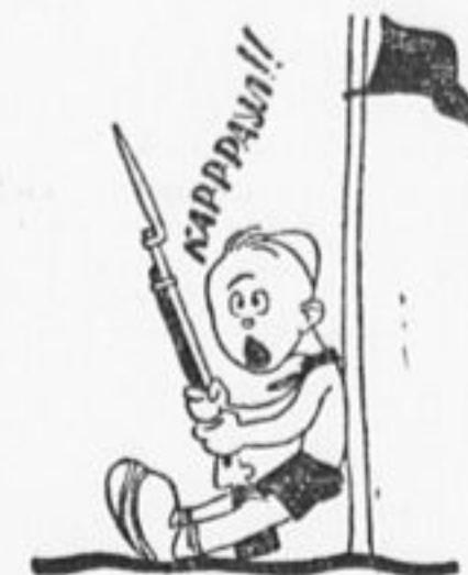
Поставили Колю на караул. 5 часов его никто не сменил. Коля устал и закричал: «Караул!» От такой военизации избавьте меня!

В июне отряд выезжает в лагерь на Украину. Работа по военизации не только не ослабнет, но наоборот, еще более упрощается. В лагере берутся три винтовки и несколько противогазов.