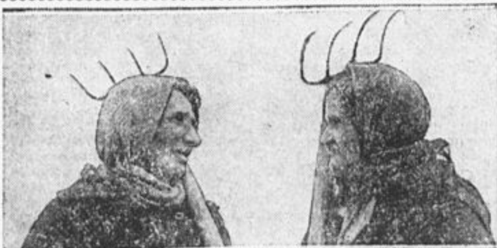
Раньше еврейки знали только кухню. Теперь они вместе с мужьями строят новую коллективную деревню.